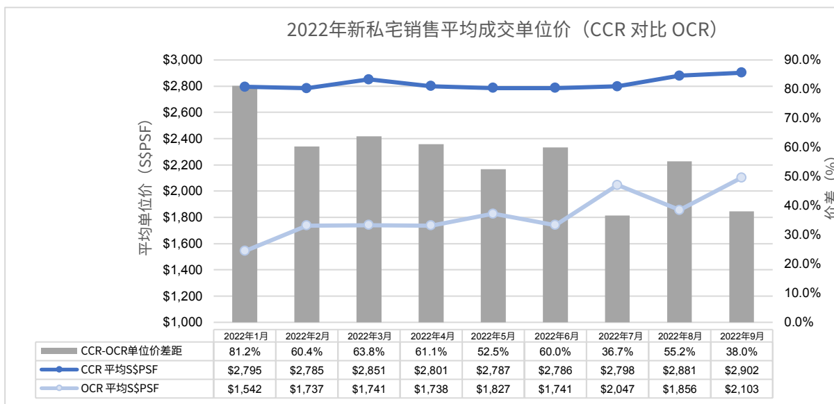
图 2: 新私宅销售平均成交单位价 (CCR 对比 OCR)